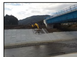
被覆ブロック据付