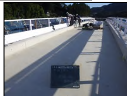
ガードレール設置