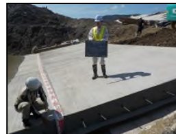
船着き場 被覆シート