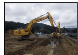
旧ローソン擁壁撤去