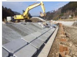
ブロック据付状況