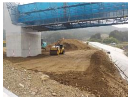
右岸橋台部 盛土状況