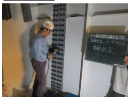
箱桁内部 ボルト締付状況