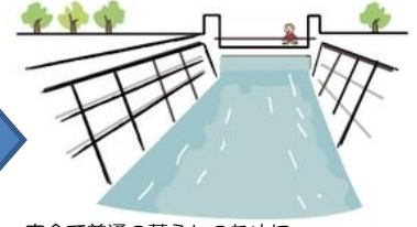
安全で普通の暮らしのために、 川を整備していく必要があります。