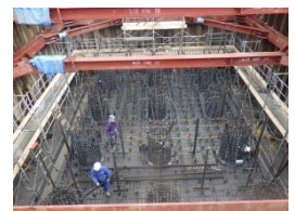
ワーキング鉄筋組立