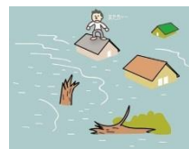
「河川の仕事」を しっかりやらないと…

普通の暮らしのために、河川のことについて考えていく仕事、それが「河川の仕事」です。