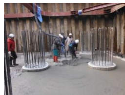
均しコンクリート状況