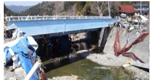
被災当時の大沢第二橋

近隣地区の皆様には、ご不便をおかけすること多くなるかもしれませんが、ご理解とご協力の程、宜しくお願い致します。