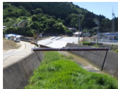
仮設水道の河川横断