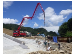
旧船揚場 整備状況