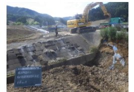
取付道路の撤去状況