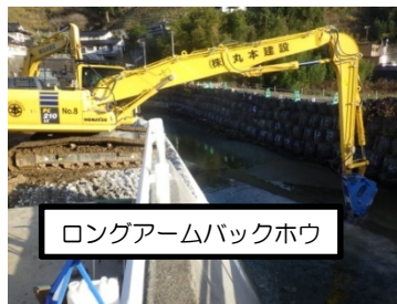
ロングアームバックホウ

通常の機械では河川の奥にある撤去護岸まで届きません。そこで、通常の機械より約3m長いロングアームバックホウを使用して撤去しました。